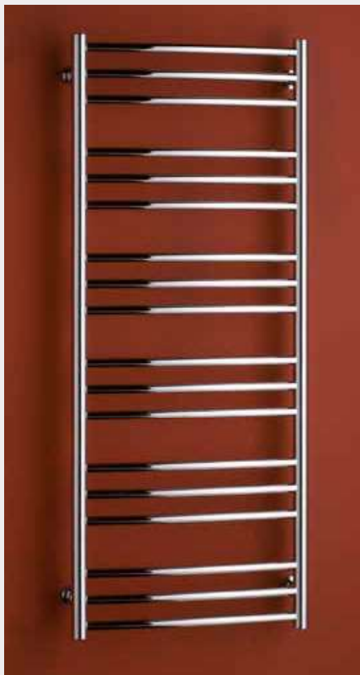
LAVENO LN4C – vyhotovenie chróm 600 × 1210 mm