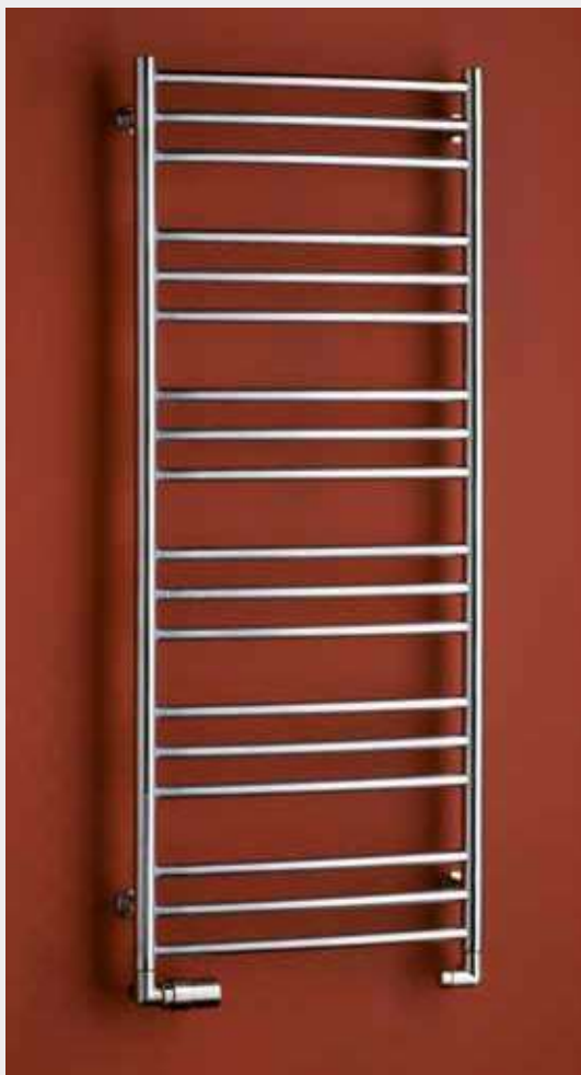
LAVENO LN3SS – vyhotovenie kartáčovaná nerez 500 × 1210 mm