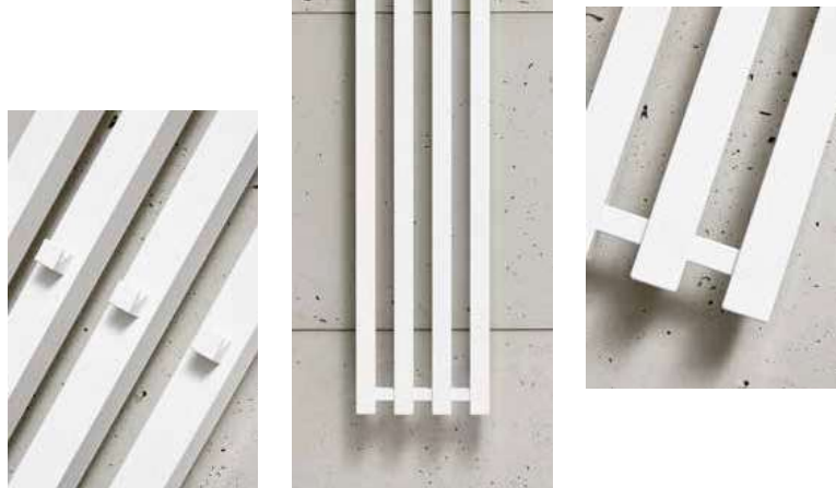
PLUTO P2W/4 biały 245 x 1500 mm

Umieszczenie mocowań: ↓ 75 mm ↑ 75 mm Ogrzewanie elektryczne: TAK Połączenie systemów grzewczych: TAK Pionowe rurki: 35 x 35 mm