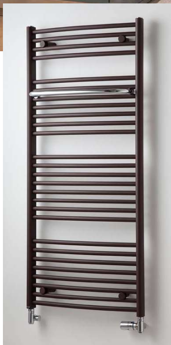
BLLENHEIM B5BR provedení hnědá (strukturální barva) 600 × 1290 mm