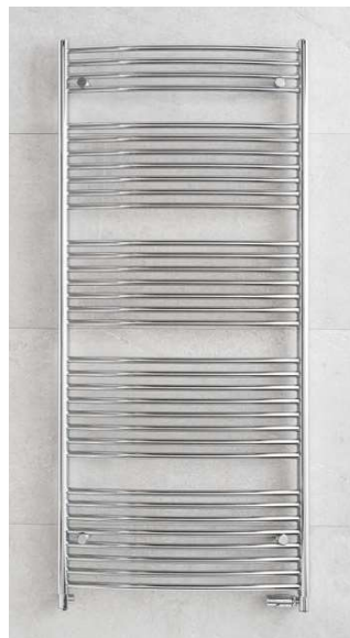
BLLENHEIM CB8 provedení chrom 600 × 1640 mm

Centrální vytápění: ANO Kombinované vytápění: ANO Elektrické vytápění: ANO Horizontální trubky: Ø 20 mm Vertikální trubky: 50 × 30 × 1,5 mm